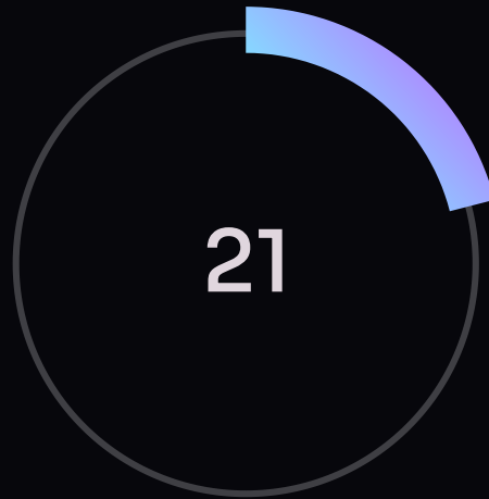
Días de Libertad

Veamos el impacto real y medible que has logrado en estos 21 días extraordinarios: